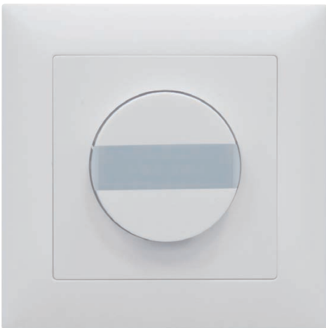
B.E.G. Luxomat IS von Swisslux im EDIZIOdue Design

Der Intelligente Lichtschalter B.E.G. Luxomat IS von Swisslux wird wie ein ganz gewöhnlicher Lichtschalter bedient, es sind keinerlei Erklärungen notwendig. Der neuartige Schalter kommt immer dann ins Spiel, wenn das manuelle Ablöschen des Lichts vergessen geht, wie zum Beispiel nach dem Verlassen eines Raumes. So schaltet das Licht in der Toilette oder im Gang automatisch aus, wenn der Raum für eine längere Zeit nicht mehr betreten wurde. Auch für Schlafzimmer und Wohnräume ergeben sich ganz neue Möglichkeiten: Sobald das natürliche Tageslicht im Raum ausreicht und das Kunstlicht deshalb nicht mehr gebraucht wird, schaltet der Intelligente Lichtschalter das Licht selbständig aus. Sei dies im Esszimmer während dem Frühstück, oder beim morgendlichen Spielen der Kinder in ihren Zimmern. Besitzer von Intelligenten Lichtschaltern brauchen sich keine Gedanken um brennende Lichter mehr zu machen, sondern können die Wohnung jederzeit getrost verlassen. Das Licht löscht automatisch.